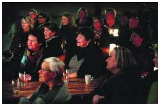
LYTTET: I underkant av 200 publikummere kom for å høre om Arne Næss under gårdsdagens filosofikafé på Kick.